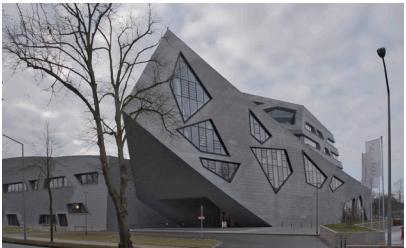
Université Leuphana à Lüneburg