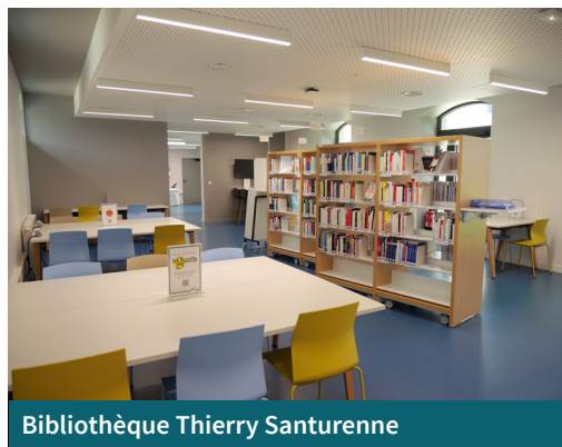
Bibliothèque Thierry Santurenne

La Bibliothèque Universitaire Thierry Santurenne, ouverte depuis janvier 2024, est là pour vous accompagner du lundi au vendredi, de 9h à 19h. Vous y trouverez un lieu accueillant pour travailler en toute tranquillité, seul ou en groupe, et accéder à une documentation riche, adaptée à vos études. Les bibliothécaires sont à votre écoute pour vous aider dans vos recherches, avec la possibilité de prendre rendez-vous pour un accompagnement personnalisé. Profitez aussi des services pratiques comme l'impression, la recharge de vos appareils, et l'accès à des documents venus d'autres bibliothèques.