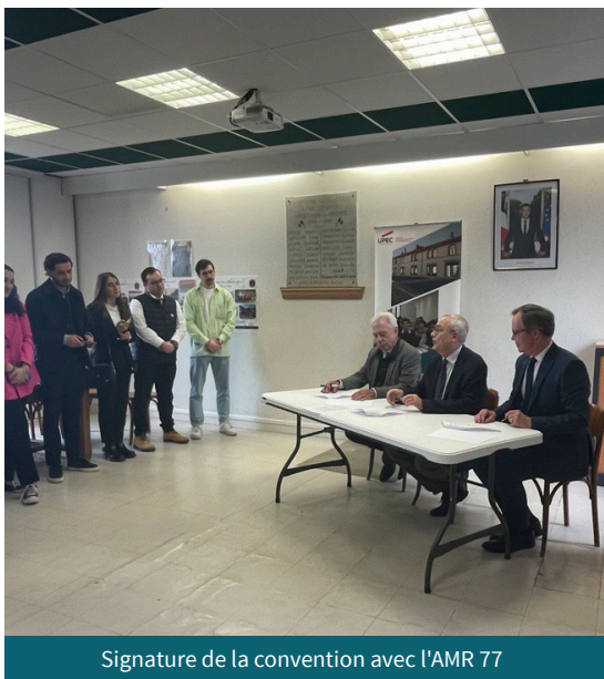
Signature de la convention avec l'AMR 77

Très concrètement, pour les collectivités territoriales ou leurs groupements, dans le département et au-delà, la collaboration avec l'IEP permet de proposer des formations aux élu(e)s sur des enjeux divers, tels que les dynamiques et politiques territoriales, les finances publiques, l'ingénierie de projets, la valorisation des actions menées dans les territoires, et les grands débats qui traversent notre société. Ce partenariat permet aussi d'offrir aux étudiantes et étudiants qui le souhaitent des opportunités de stage auprès des mairies, des intercommunalités et des administrations de Seine-et-Marne et des départements environnants. L'occasion de mettre en œuvre des actions concrètes en matière de politiques publiques d'éducation, de déchets, et d'aménagement ou encore comme conseillers auprès des élu(e)s.