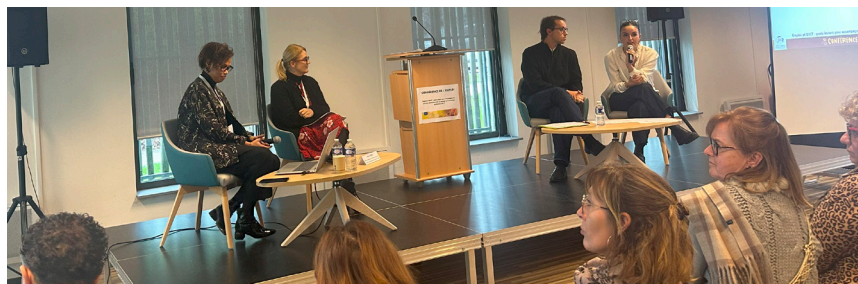
Présentation des résultats du sondage "Attractivité de la fonction publique" au CDG 77