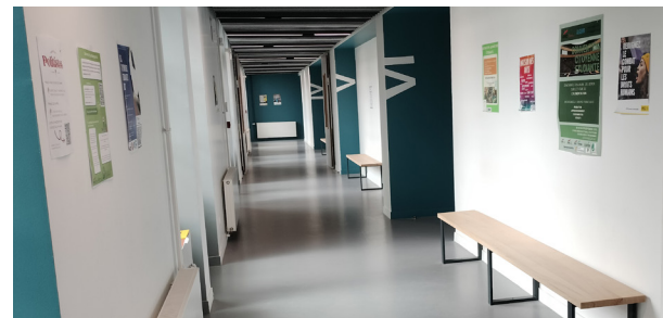
Vue intérieure du bâtiment principal