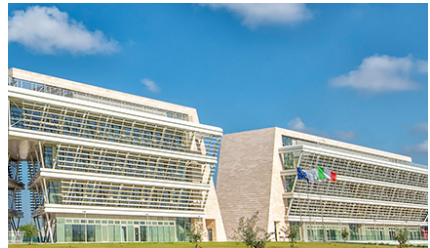
Tor Vergata à Rome