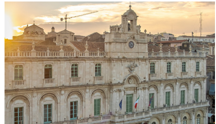
Université de Catane