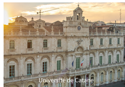
Université de Catane