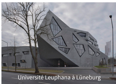
Université Leuphana à Lüneburg