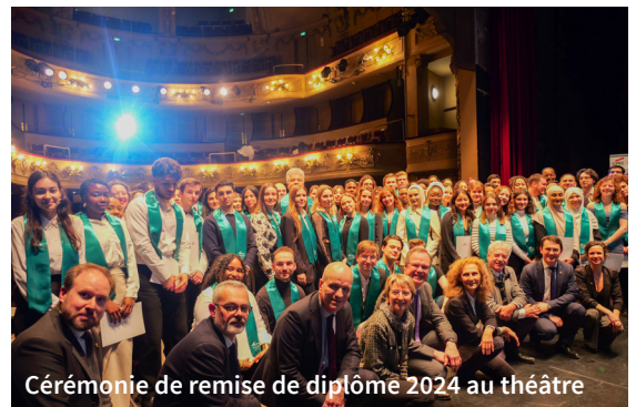
Cérémonie de remise de diplôme 2024 au théâtre