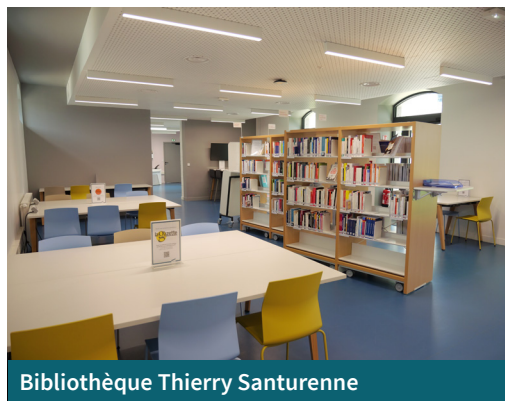
Bibliothèque Thierry Santurenne

La Bibliothèque Universitaire Thierry Santurenne, ouverte depuis janvier 2024, est là pour vous accompagner du lundi au vendredi, de 9h à 18h. Vous y trouverez un lieu accueillant pour travailler en toute tranquillité, seul ou en groupe, et accéder à une documentation riche, adaptée à vos études. Les bibliothécaires sont à votre écoute pour vous aider dans vos recherches, avec la possibilité de prendre rendez-vous pour un accompagnement personnalisé. Profitez aussi des services pratiques comme l'impression, la recharge de vos appareils, et l'accès à des documents venus d'autres bibliothèques.