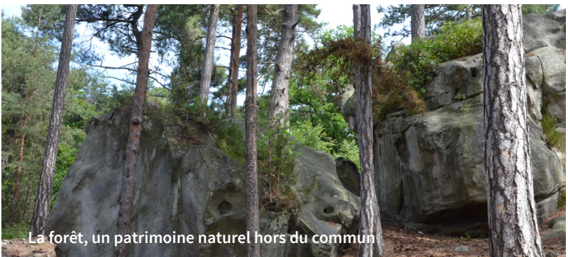
La forêt, un patrimoine naturel hors du commun