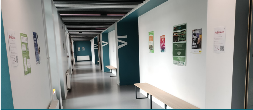
Vue intérieure du bâtiment principal