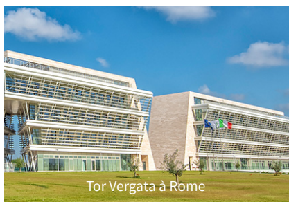
Tor Vergata à Rome