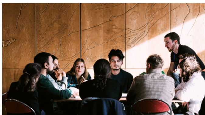
Redéfinition des politiques publiques de Noyal-sur-Vilaine

Pour rappel, les marchés de « prestations intellectuelles » de moins de 40 000 € HT sont attribués librement à un prestataire par les collectivités. Entre 40 000 et 215 000 € HT, cette attribution se fait dans le cadre d'un marché à procédure adaptée.