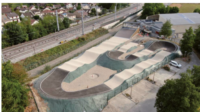
Elaboration du projet de construction de pistes BMX